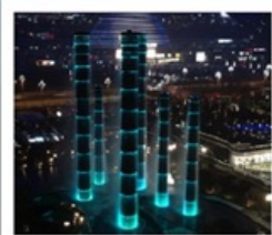
ห้างสรรพสินค้า SKP