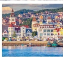
ท่าเรือประมงเขียนโก๋

เรือลิวส์ / ย่านฮั่นเล่อฟาง / ถนนฮั่วจวิปา ท่าเรือประมงเขียนโก๋ / ย่านองโหว่ 1920 / ถนนโบราณเฉาหยาง หอคอยกาลเวลา / ชายหาดจินซา / รูปปั้นปลาวาฬ / หาดทรายซาจื่อโหว่ หาดไซเบอร์ NO.3 / โรงงานเบียร์ชิงเต่า / โบสถ์ St. Emil ถนนคนเดินไต้ตง / สะพานจันเฉียว / จัตุรัส 54 / ห้าง MIXC