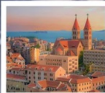
โบสถ์ ST. EMIL

ชิงเต่า · เว่ยไห่ · เขียนโก๋ 6 DAYS 4 NIGHTS