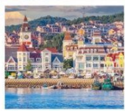
ท่าเรือประมงเหยียนโก๋