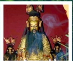
เฮียงบู๊ซิว