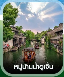
หมู่บ้านน้ำอูเจิน