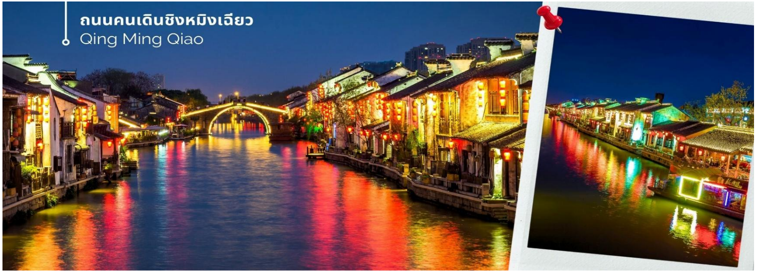
ถนนคนเดินชิงหมิงเฉียว Qing Ming Qiao

จากนั้นให้ท่านเดินชมบรรยากาศพื้นเมืองโบราณของ ถนนคนเดินชิงหมิงเฉียว เราจะได้เห็นบรรยากาศ บ้านเรือนสไตล์จีนโบราณ ร้านค้าต่างๆ ที่ขายสินค้าพื้นเมือง เสื้อผ้า ขนม ของประดับตกแต่ง ของฝาก ของที่ระลึกสวยๆ ให้เดินดูกันอย่างเพลิดเพลิน