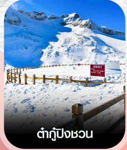
ต้ากู่ปิงชอน