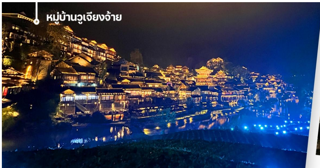
หมู่บ้านวูเจียงจ้าย

จากนั้นนำท่านเดินทางสู่หมู่บ้านวูเจียงจ้าย (Wujiang Zhai) เป็นหมู่บ้านโบราณในมณฑลกุ้ยโจว ประเทศจีน ที่มีความสำคัญทางวัฒนธรรมและเป็นที่ตั้งถิ่นฐานของชนเผ่าต้งและชนเผ่าม้ง หมู่บ้านแห่งนี้ตั้งอยู่ในหุบเขากลางที่รายล้อม