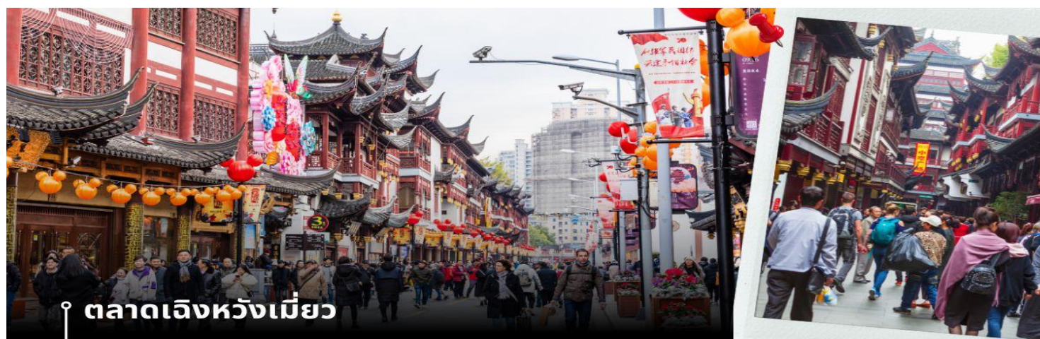
ตลาดเฉินหวังเหมียว

นำท่านเดินทางสู่ หมู่บ้านโบราณจูเจียเจี้ยว มีฉายาว่า เวนิซตะวันออกแห่งเมืองเซี่ยงไฮ้ เป็นอีกหนึ่งย่านเก่าริมน้ำที่มีชื่อเสียงในเซี่ยงไฮ้ มีประวัติศาสตร์ยาวนานกว่า 1700 ปี ซึ่งพื้นที่ทั้งหมดได้รับการอนุรักษ์ไว้เป็นอย่างดี จุดเด่นของเมืองโบราณแห่งนี้คือพื้นที่ด้านในนั้นมีแม่น้ำหลากหลายสายเชื่อมโยงไปยังพื้นที่ต่างๆ โดยรอบ ทำให้มีบรรยากาศที่สวยงามและร่มรื่น และให้ท่าน ล่องเรือ ชมวิวบ้านเรือนเก่าแก่ริมน้ำ ได้เวลาอันสมควรเดินทางสู่ มหานครเซี่ยงไฮ้ จากนั้นนำท่านสู่ ตลาดโบราณ 100 ปี เฉินหวังเหมียว เป็นศูนย์รวมสินค้า และอาหารพื้นเมืองที่แสดงถึงเอกลักษณ์ของชาวเซี่ยงไฮ้ซึ่งมีการผสมผสานระหว่างอดีตและปัจจุบันได้อย่างลงตัว ซึ่งเป็นย่านสินค้าราคาถูกที่มีชื่ออีกย่านหนึ่งของนครเซี่ยงไฮ้ ให้ท่านอิสระช้อปปิ้งตามอัธยาศัย