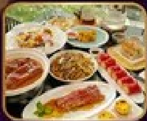
อาหารจีน 10 มื้อ