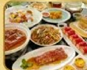
อาหารจีน 10 มื้อ