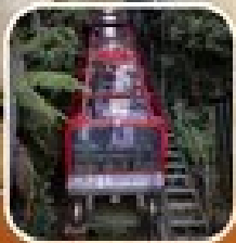
ดูทิวทัศน์จากรถไฟไอน้ำ