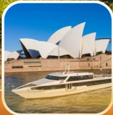
ล่องเรือชมอ่าวซิดนีย์