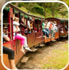
รถไฟจักรไอน้ำโบราณ