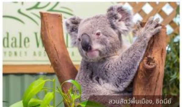
สวนสัตว์ฟีนเมือง, ซิดนีย์