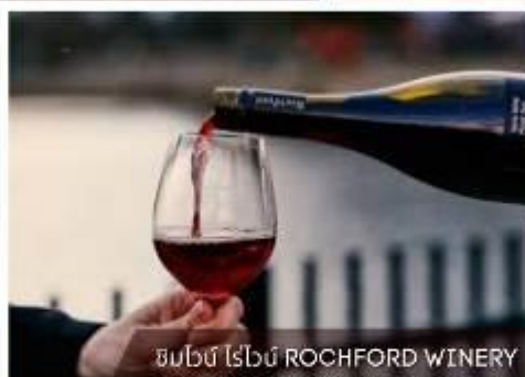
ชิมไวน์ ไรน์ ROCHFORD WINERY