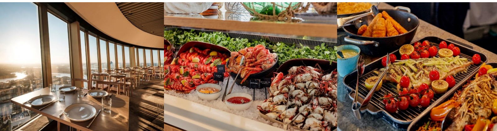
*เมนูมีการปรับเปลี่ยนตามฤดูกาล*

นำท่านเข้าสู่ที่พัก SYDNEY METRO MARLOW HOTEL / HOLIDAY INN POTTS POINT หรือเทียบเท่า (คืนที่5)