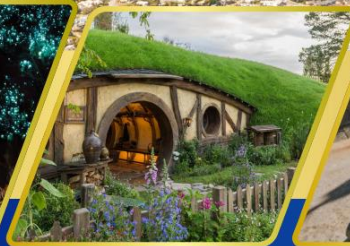
หมู่บ้านฮอบบิต