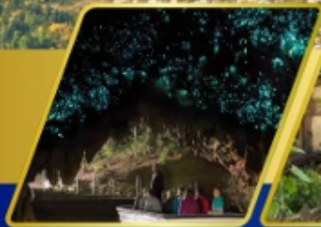
ถ้ำหอนเรื่องแสง