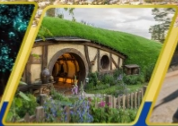
หมู่บ้านฮอบบิต