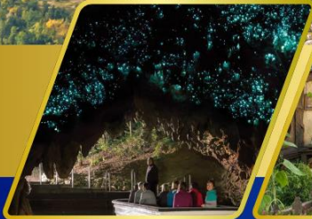
ถ้ำหอนเรื่องแสง