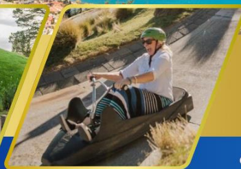
เล่นลู่ ที่ควีนส์ทาวน์

✈️ บินภายใน (เที่ยวสุดคุ้ม) พักโรงแรม 4 ดาว ★★★★★