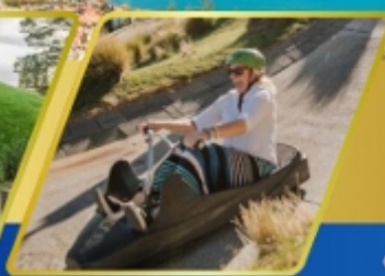
เล่นลู่ที่ควีนส์ทาวน์

AUCKLAND / ROTORUA / CHRISTCHURCH FOX GLACIER / FRANZ JOSEF / QUEENSTOWN