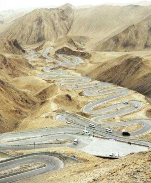
ถนนมังกรพันโค้ง/ผานหลง (Panlong Ancient Road)