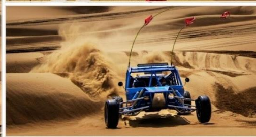
OPTION TOUR เลือกซื้อกิจกรรม สนุกสุดเหวี่ยงในทะเลทราย