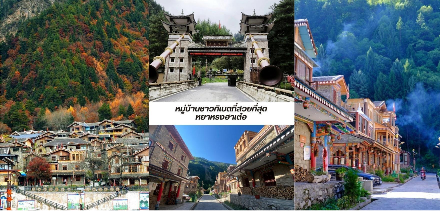
หมู่บ้านชาวกิเบตที่สวยงามที่สุด หย่าหงฮาเต๋อ

บ่าย นำท่านชม หมู่บ้านชาวกิเบตที่สวยงามที่สุด หย่าหงฮาเต๋อ (Yangrong Hades,羊茸哈德) หมู่บ้าน แห่งนี้เคยเป็นหมู่บ้านยากจนบนภูเขา แต่ด้วยการย้ายถิ่นฐานและพัฒนาการท่องเที่ยว ทำให้กลายเป็นจุดหมาย ปลายทางที่ดึงดูดนักท่องเที่ยวจากทั่วโลก ทัศนียภาพอันงดงาม หย่าหงฮาเต๋อล้อมรอบด้วยภูเขาสูง มีแม่น้ำเฮย์ส่วย (黑水河) ไหลผ่าน และป่าไม้เขียวชอุ่มตลอดปี โดยเฉพาะในฤดูใบไม้ร่วง ป่าไม้จะเปลี่ยนเป็นสีสดใสของใบไม้เปลี่ยนสี ทำให้ทั้งหมู่บ้านดูเหมือนอยู่ในภาพวาดอันงดงาม หมู่บ้านนี้ยังคงรักษาเอกลักษณ์วัฒนธรรมกิเบตดั้งเดิม ทั้งการ แต่งกาย อาหารท้องถิ่น และพิธีกรรมทางศาสนา หย่าหงฮาเต๋อ ไม่เพียงแต่เป็นสถานที่ท่องเที่ยวที่สวยงาม เท่านั้น แต่ยังเป็นหมู่บ้านที่สะท้อนให้เห็นถึงการพัฒนาจากความยากจนสู่ความมั่งคั่งผ่านการผสมผสานการอนุรักษ์วัฒนธรรม ดั้งเดิมกับการท่องเที่ยวได้อย่างลงตัว