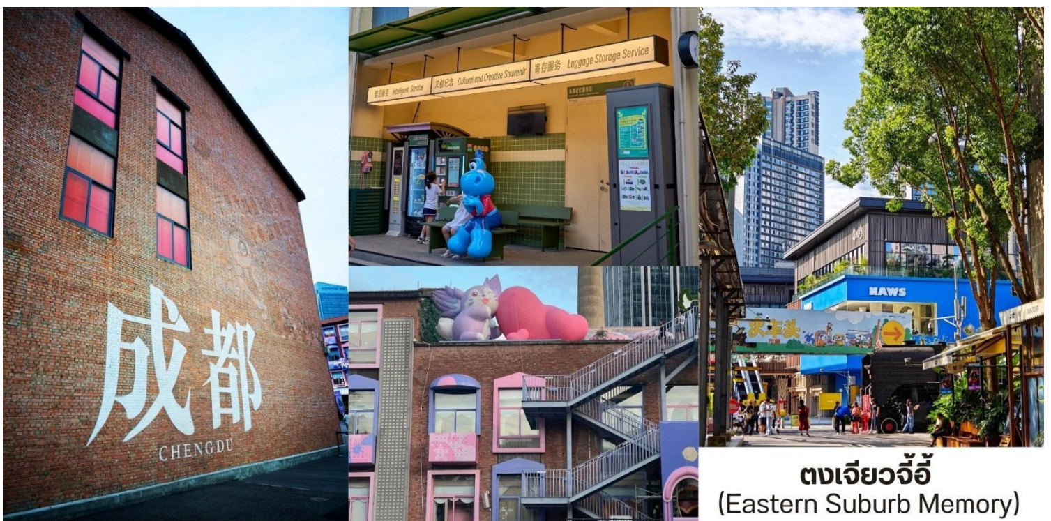
ตงเจียวจี้ (Eastern Suburb Memory)

เที่ยง บริการอาหารกลางวัน ณ ภัตตาคาร พิเศษ...สุกี้เสฉวน