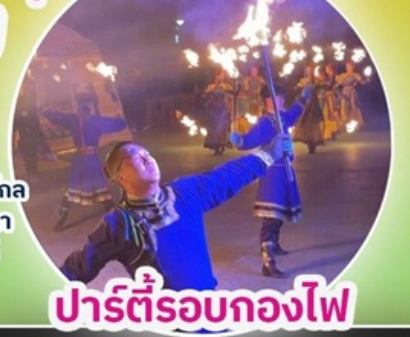
ปาร์ตี้รอกองไฟ