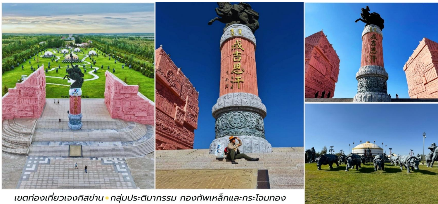
เขตท่องเที่ยวเจงกิสข่าน • กลุ่มประติมากรรม กองทัพเหล็กและกระโจมทอง