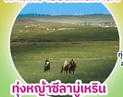
ทุ่งหญ้าซิลามูเหริน