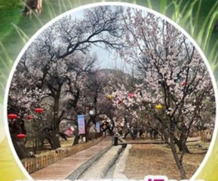
หุบเขาดอกแอปเปิ้ล

ทุ่งหญ้าซิลามูเหริน - พิธีการขอพรจากโอเวบา - ปาร์ตี้กองไฟ - หมู่บ้านชนเผ่ามองโกล สวนวัฒนธรรมมองโกลเหมิงเสียง - หุบเขาดอกแอปเปิ้ล - ทะเลทรายอินเคินทาลา แหล่งวัฒนธรรมมองโกลหยวนหลิว (รวมรถกอล์ฟ 2 ขา) - ตลาดกลางคืนเจียไถ่ สวนวัฒนธรรมการแต่งงานสุดเอ็กซ์คลูซีฟแห่งเดียวในประเทศจีน บ้านองค์ปฐม - เขตการท่องเที่ยวเจงกิสข่าน-ถนนคนเดินคังปาซื่อ