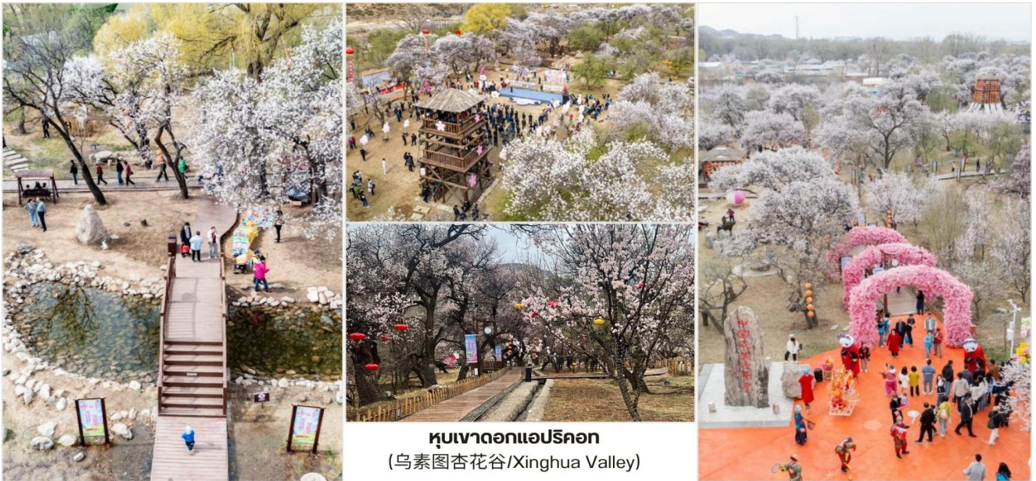
หุบเขาดอกแอปริคอต (乌素图杏花谷/Xinghua Valley)

บ่าย นำท่านชม หุบเขาดอกแอปริคอต (乌素图杏花谷/Xinghua Valley) หรือ "ชิงฮวาถู" เป็นหุบเขา ที่พื้นที่บริเวณดังกล่าวเต็มไปด้วยต้นแอปริคอต และเมื่อคราวใดก็ตามถึงช่วงเวลาที่ยอดดอกแอปริคอตเบ่งบาน หุบเขาแห่งนี้จะถูกปกคลุมไปด้วยสีชมพูหวาน จนทำให้สถานที่แห่งนี้เป็นหนึ่งในแลนด์มาร์กดึงดูดนักท่องเที่ยวให้ เดินทางไปชมภูเขาสีชมพูด้วยตาตัวเอง