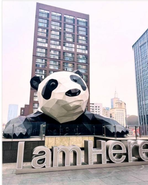
หมีแพนด้ายักษ์ กำลังป็นตึก IFS