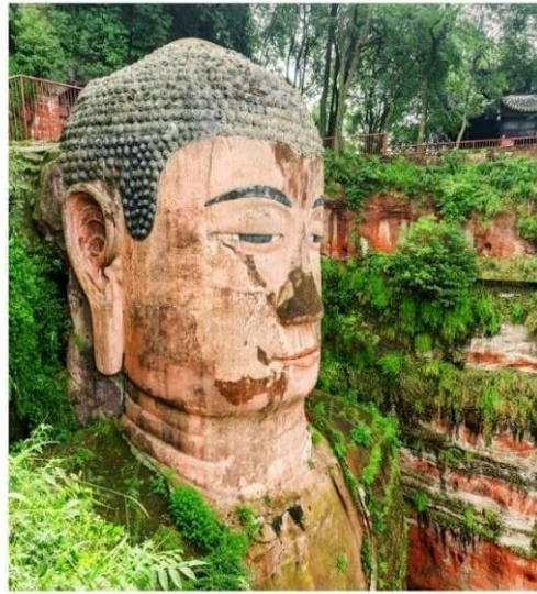
พระใหญ่เล่อซาน

บ่าย นำท่านล่องเรือชม พระใหญ่เล่อซาน (Leshan Giant Buddha, 乐山大佛) คือแลนด์มาร์กระดับตำนานที่คนทั่วโลกอยากไปเห็นด้วยตาตัวเอง องค์พระเป็น พระศรีอริยเมตไตรย (Maitreya Buddha) แกะสลักจากหน้าผาหินริมแม่น้ำ สูงถึง 71 เมตร และถือว่าเป็น พระพุทธรูปหินแกะสลักที่สูงและใหญ่ที่สุดในโลก สร้างขึ้นตั้งแต่สมัยราชวงศ์ถังและยืนหยัดมากกว่า 1,200 ปี โดยองค์พระตั้งตระหง่านอยู่บนหน้าผา หลังอวิ้นซาน (凌云山) มองลงไปยัง