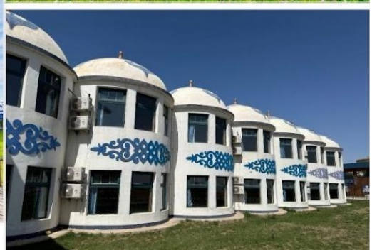
ORDOS GRASSLAND RESORT

ที่พัก Ordos Grassland Resort ระดับ 4* หรือเทียบเท่า ที่พักตกแต่งสไตล์กระท่อมมองโกเลีย ท่ามกลางความงดงามอันกว้างใหญ่ของทุ่งหญ้าแห่งมองโกเลียใน