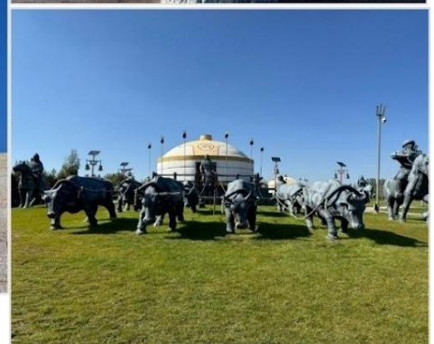
เขตท่องเที่ยวเจงกิสข่าน • กลุ่มประติมากรรม กองทัพเหล็กและกระโจมทอง