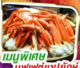
เมนูพิเศษ บุฟเฟต์ซาปูยักษ์

ราคาเพียง 35,999 *รวมภาษีมูลค่าเพิ่มแล้ว*