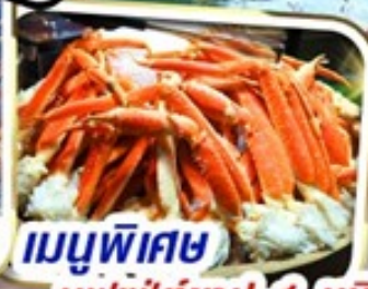
เมนูพิเศษ บุฟเฟ่ต์ชาบู 1 ชนิด