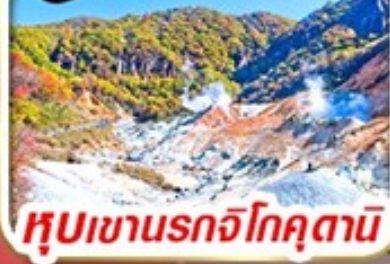
หุบเขานรกโจคุตานิ

รวม ค่าภาษีที่ปรับขึ้นแล้ว (ประกาศ 1 เม.ย. 69)