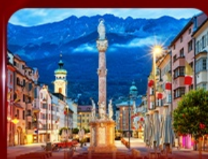
เที่ยวย่านเมืองเก่า อินส์บรุค