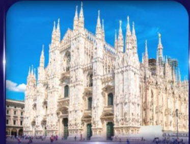
เข็ควินวิหารดูโอโม มิลาโน