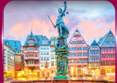
จัตุรัสโรเมอร์ ไพรงก์เฟิร์ต