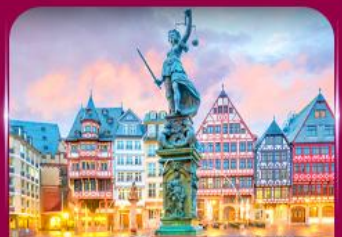
จัตุรัสโรเมอร์ แพรงก์เฟิร์ต