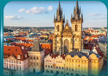
ชมปราสาทปราศ ย่านเมืองเก่า