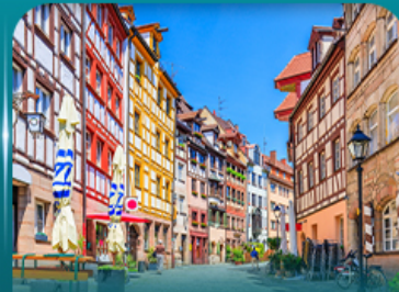
เที่ยวเมืองเก่าบูร์มเบิร์ก