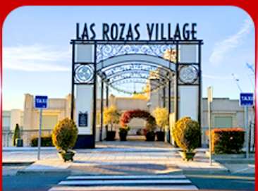
Las Rozas Village เอากีเลียน