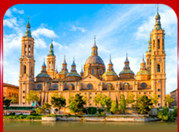
มหาวิหารแม่พระแห่งเสาคักดีสิกรี