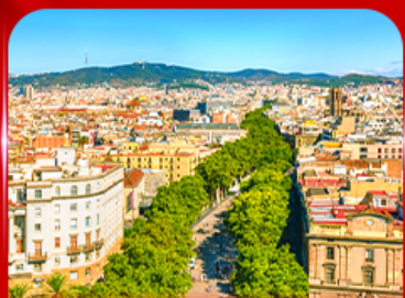
ลาริมบลาสตริก บาร์เซโลนา