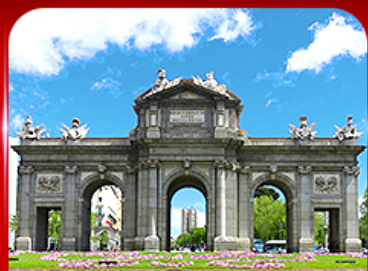
เช็ควินประตูอัลกาลา มาดริด