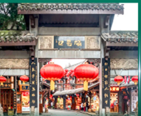
ช้อปปิ้งย่านเจียงฟางเม่ย