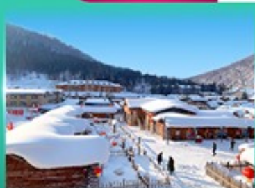
หมู่บ้านหิมะ สโนว์ทาวน์