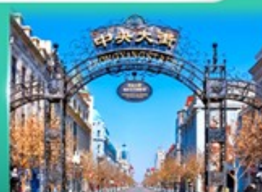
ย่านจงหยาง สตรีท