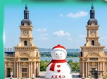
ตุ๊กตาหิมะยักษ์ ฮาร์บิน