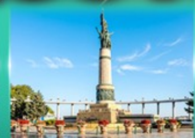
อนุสาวรีย์นิ่มหง