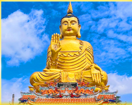
ทิวสหลวงพ่อพันล้าน