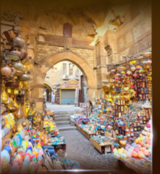
ตลาดฟานเอลคาลิ