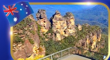
ชั้นชมวิวเทือกเขาบลูแม้นท์เนอส์