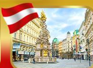
ช้อปปีงย่านคาร์ทเทินอร์สตรีก