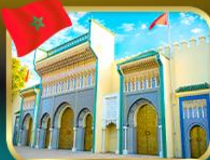
ประตูพระราชวังหลวง