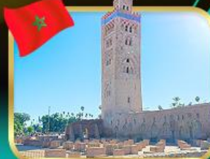
มัสยิดคูตูเบีย มาราเกช