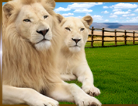
The Lion Park