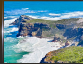
cape of good hope