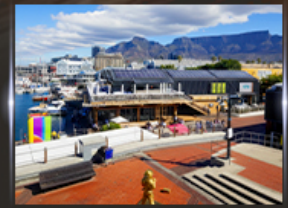
ท่าเรือ V&A waterfront