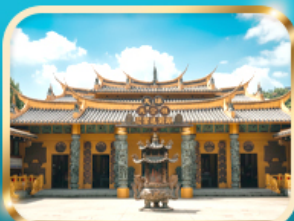
วัดต้าซี ซอกความรวย