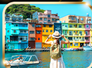
หมู่บ้านประมงเจิ้งปิ่น