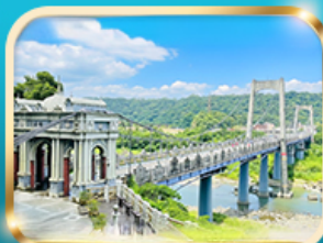
สะพานต้าซี เกาหยวน