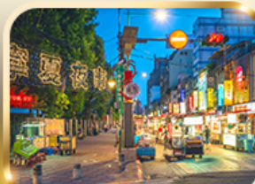
หนิงเซี่ย ไนท์มาร์เก็ต