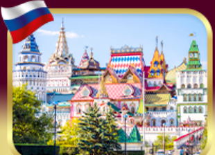
อิสมาลอฟสกีมาร์เก็ต