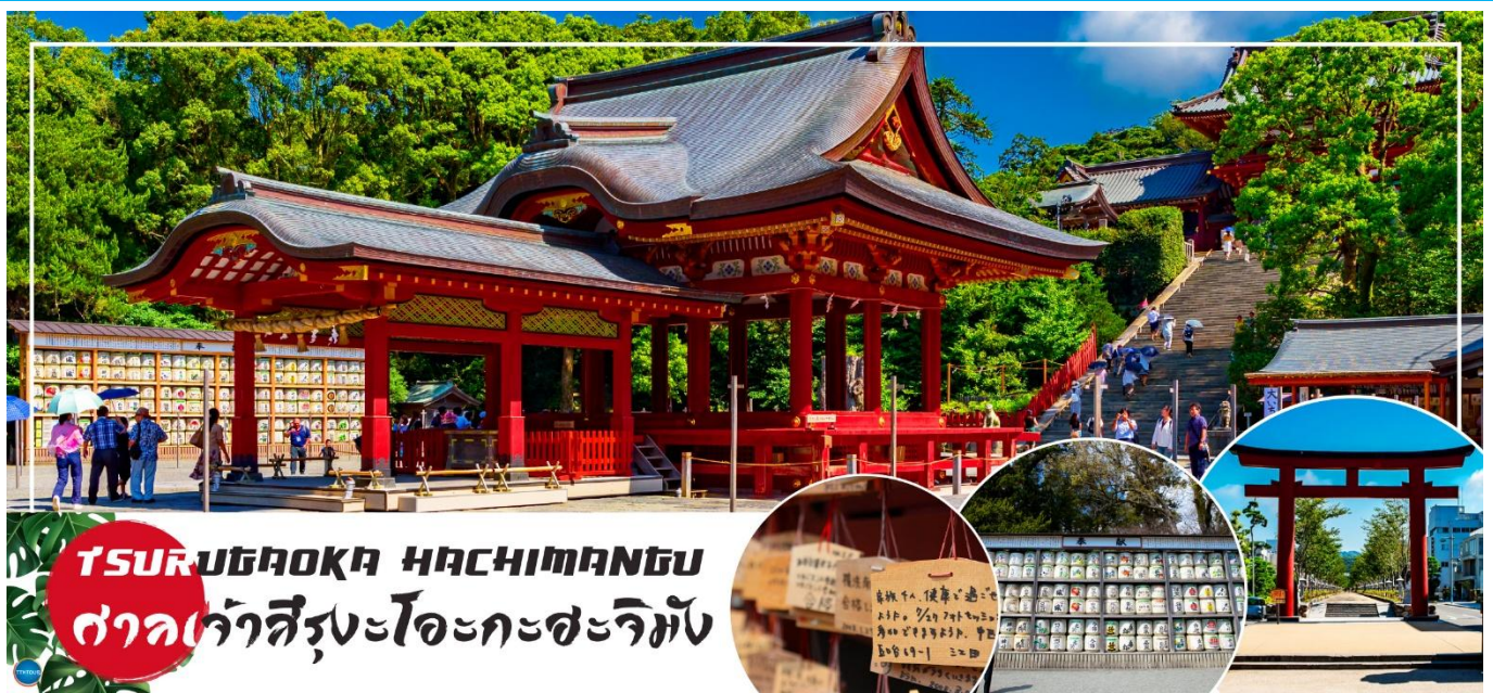
TSURUGAOKA HACHIMANGU ศาลเจ้าสิริงะโอะกะสะจิมัง

วันที่สอง ท่าอากาศยานนานาชาติ นาริตะ – เมืองคามาคุระ – ศาลเจ้าสิริงะโอะกะ สะจิมัง – ถนนโคมาจิโดริ – เกะเอโนชิมะ – ศาลเจ้าเอโนชิมะ – ถนนเบ็นไซเท็นนากามิสะ – เมืองยามานาชิ – ออนเซ็น