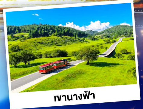
เทานางฟ้า