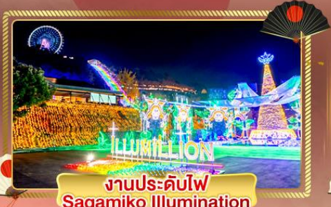
งานประดับไฟ Sagamiko Illumination

ชมความสวยงามแห่งเมือง อิบารากิ เที่ยวครบทุกวัน ฟังเสียงคลื่นซัด ณ เสาโทริอิกลางโอดหิน