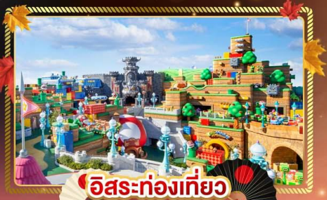
อิสระท่องเที่ยว