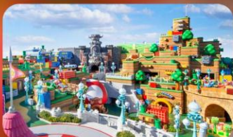
อิสระท่องเที่ยว

OSAKA HOTEL AREA หรือเทียบเท่ามาตรฐานญี่ปุ่น