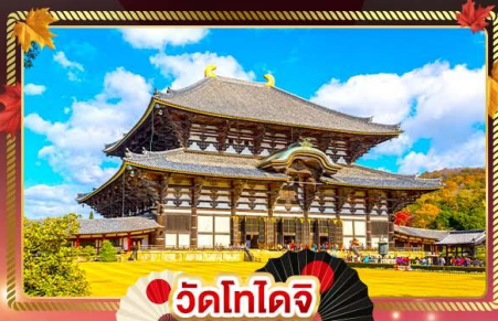
วัดโทโดจิ