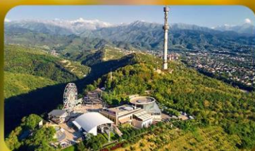
Kok Tobe Hill