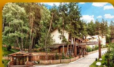
Oi-Qaragai Mountain Resort