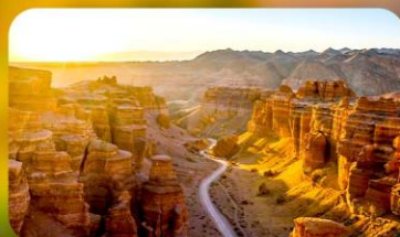
Charyn Canyon+Black Canyon