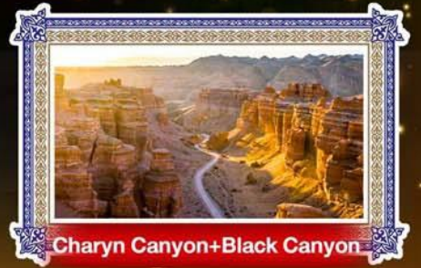
Charyn Canyon+Black Canyon