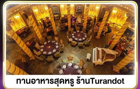
ทานอาหารสุดหรู ภัตตาคาร Turandot