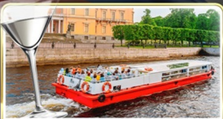
ล่องเรือแม่น้ำเนวา พร้อมเสิร์ฟ Vodka Tasting