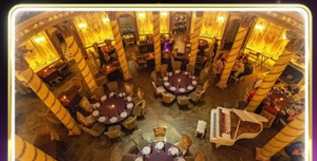
ทานอาหารสุดหรู ภัตตาคาร Turandot