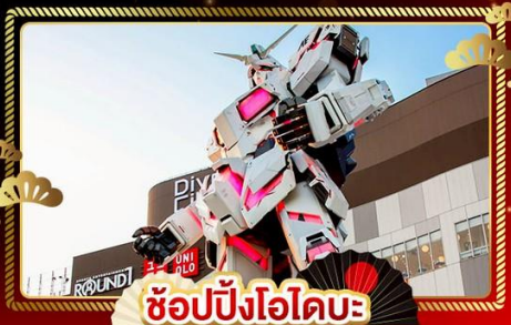
ช้อปปิงโอไดบะ