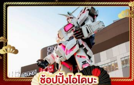
ช้อปปิงโอไดบะ