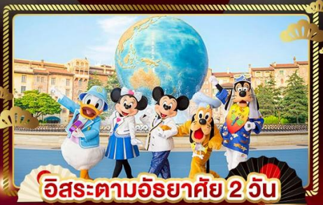
อิสระตามอริยาศัย 2 วัน