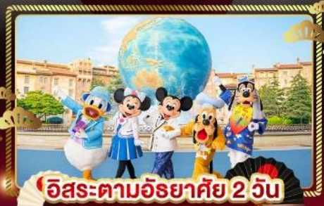
อิสระตามอริยาศัย 2 วัน