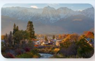
โออิเดะ ปาร์ค