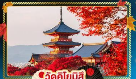
🍁 วัดคิโยมิสึ