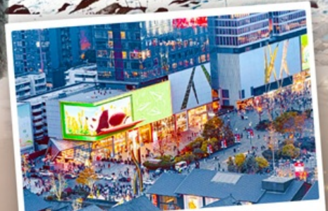
ถนนไท่กู๋หลี่หลิน