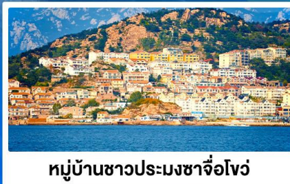
หมู่บ้านชาวประมงซาจื่อโจว