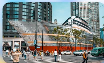
เรือทูลุยส์วิตตอง