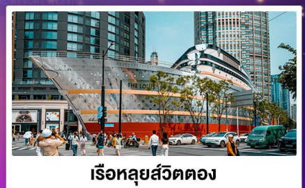
เรือหลุยส์วิตตอง