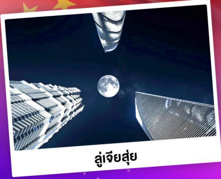
ลู่เจียซู่