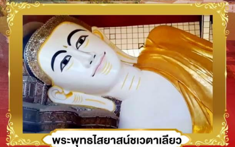
พระพุทธรูปไสยาสน์ชเวตาเลียว