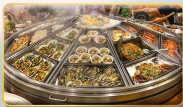
หม้อนึ่งจักรพรรดิ