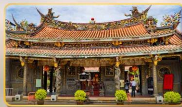
วัดต้าหลงตงเป่าอัน