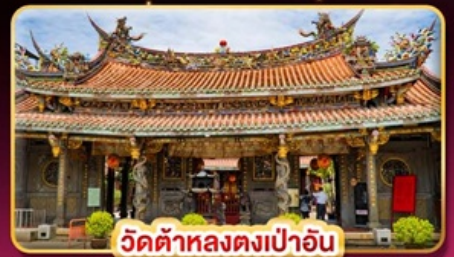
วัดต้าหลงตงเป่าอัน