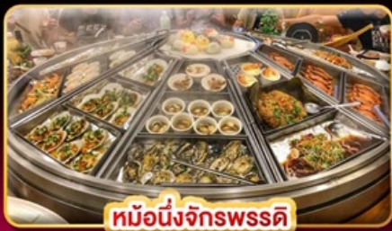
หม้อนึ่งจักรพรรดิ